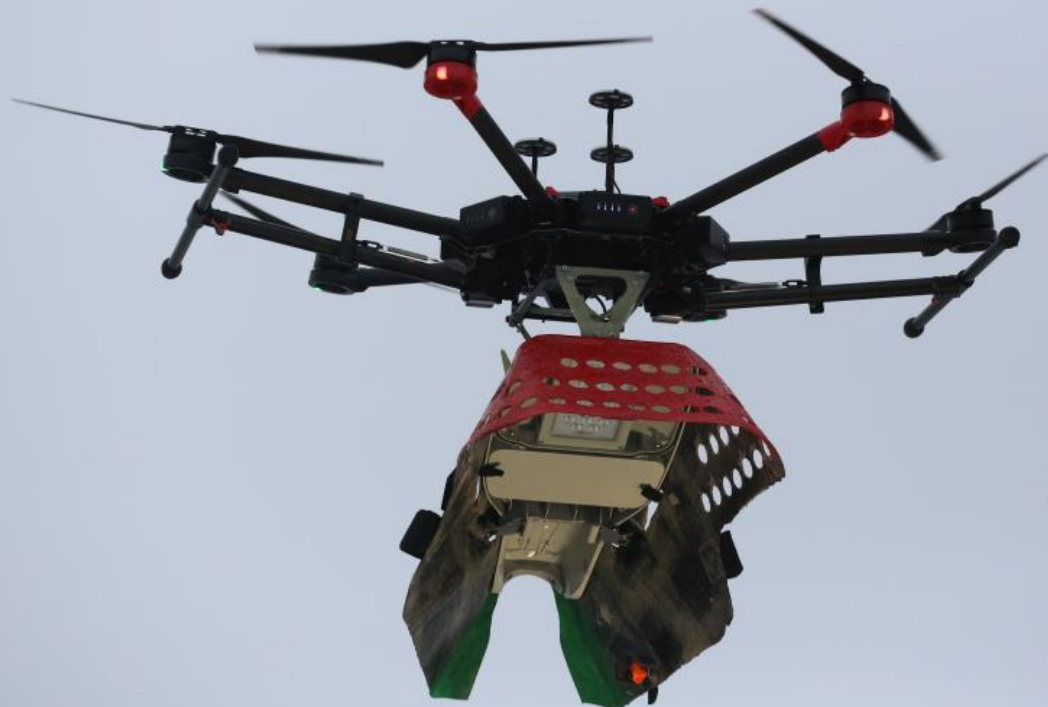
LumenAIR UAV Prototyp, Mars 2018

Systemanvändarna vill investera för framtiden, och ha vetskapen att man gjort rätt val för flera decennier framöver. Ingen tillverkare kan dock utlova att en armatur är som ny efter 20 år. Därför har vi utvecklat LumenAIR systemet och den tillhörande armaturserien för automatiserad service av gatubelysning. Två gatuarmaturer finns idag kompatibla med systemet, SMART & REVOLUTION som täcker alla vägtyper.